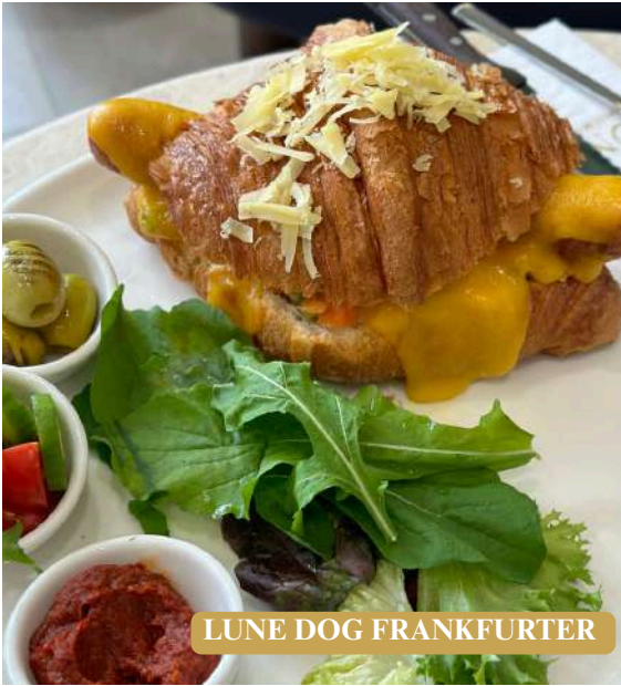
LUNE DOG FRANKFURTER