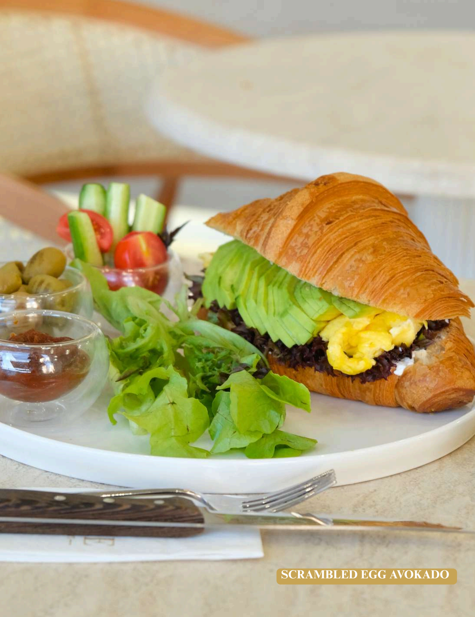
SCRAMBLED EGG AVOKADO