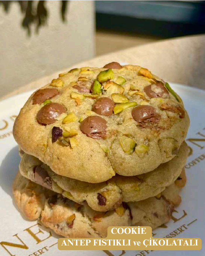
COOKIE ANTEP FISTIKLI ve ÇİKOLATALI