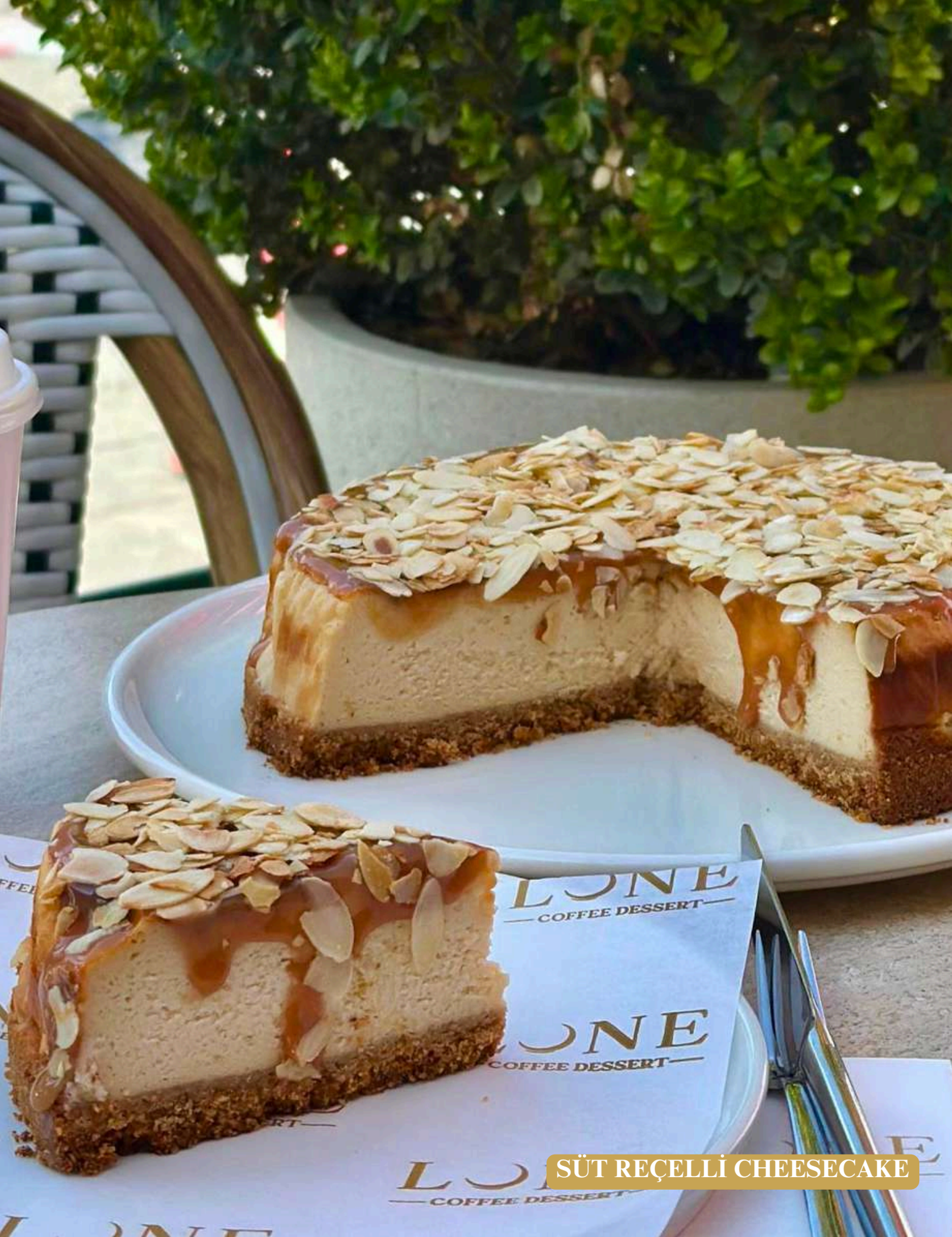
SÜT REÇELLİ CHEESECAKE