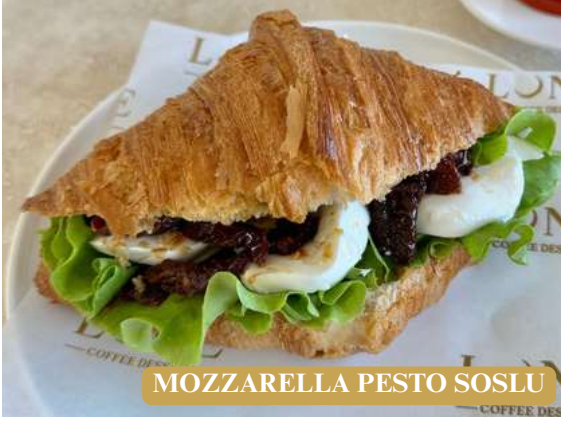
MOZZARELLA PESTO SOSLU