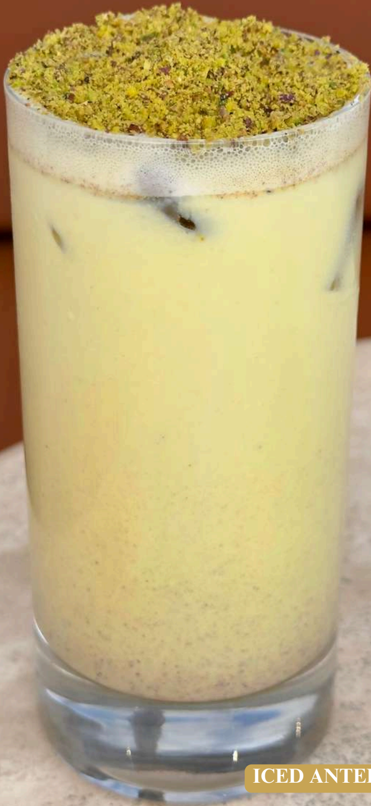
ICED ANTEP FISTIKLI LATTE