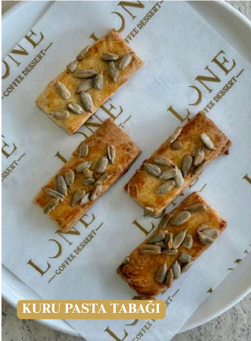
KURU PASTA TABAĐI