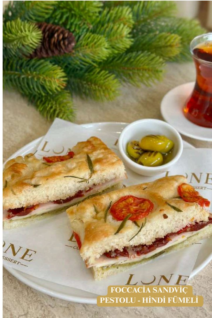
FOCCACIA SANDVIÇ PESTOLU - HİNDİ FÜMELİ