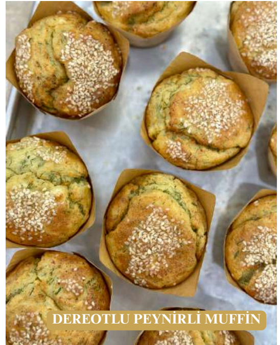
DEREOTLU PEYNİRLİ MUFFİN