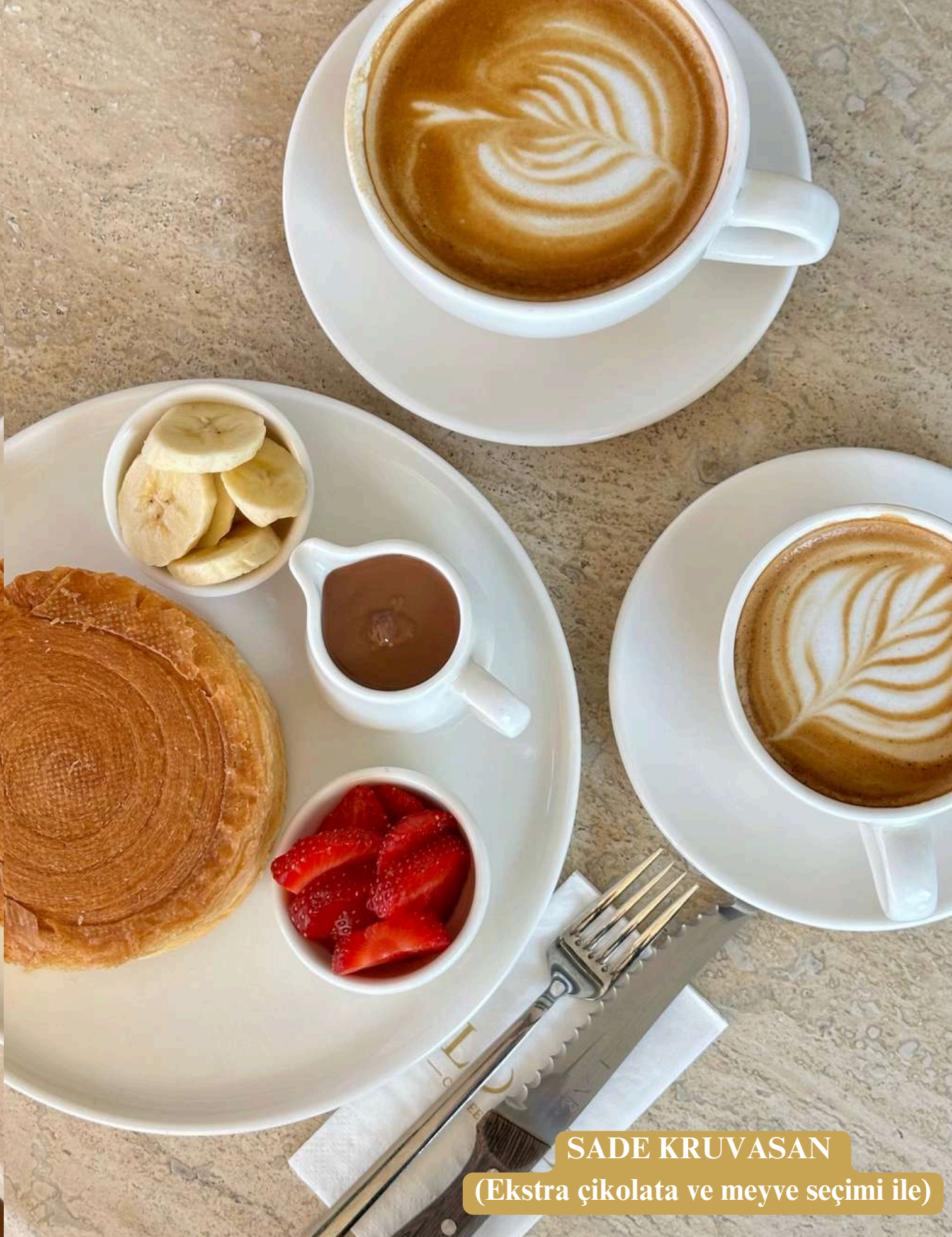
SADE KRUVASAN (Ekstra ikolata ve meyve seimi ile)