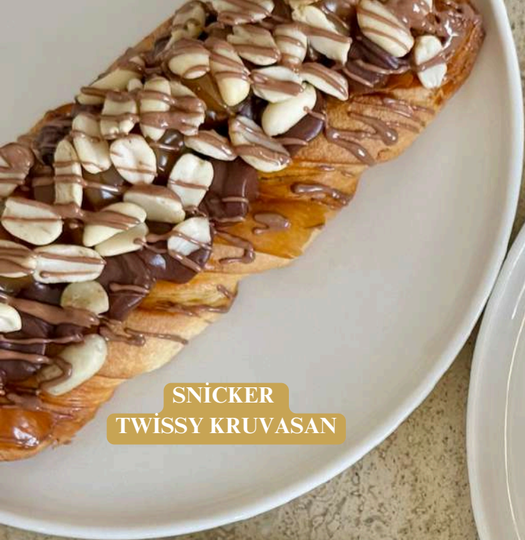
SNICKER TWISSY KRUVASAN