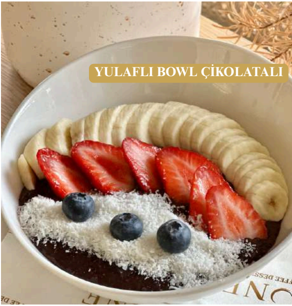
YULAF LI BOWL ÇIKOLATALI