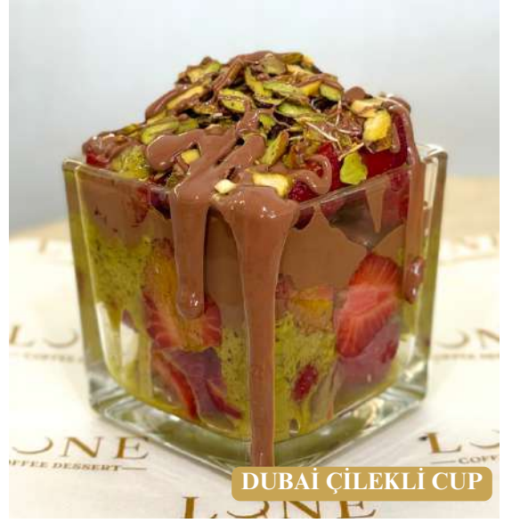
DUBAİ ÇİLEKLİ CUP