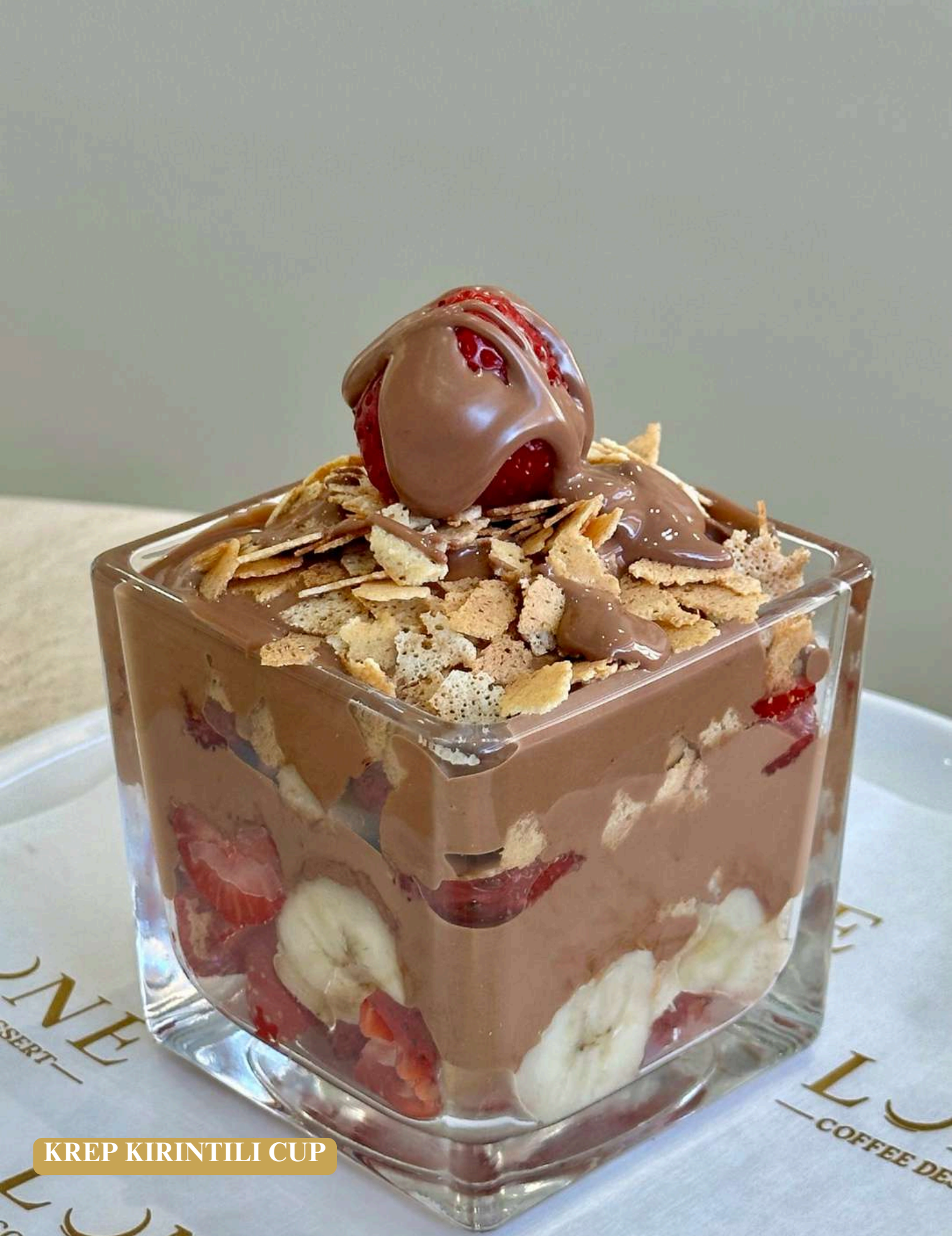
KREP KIRINTILI CUP