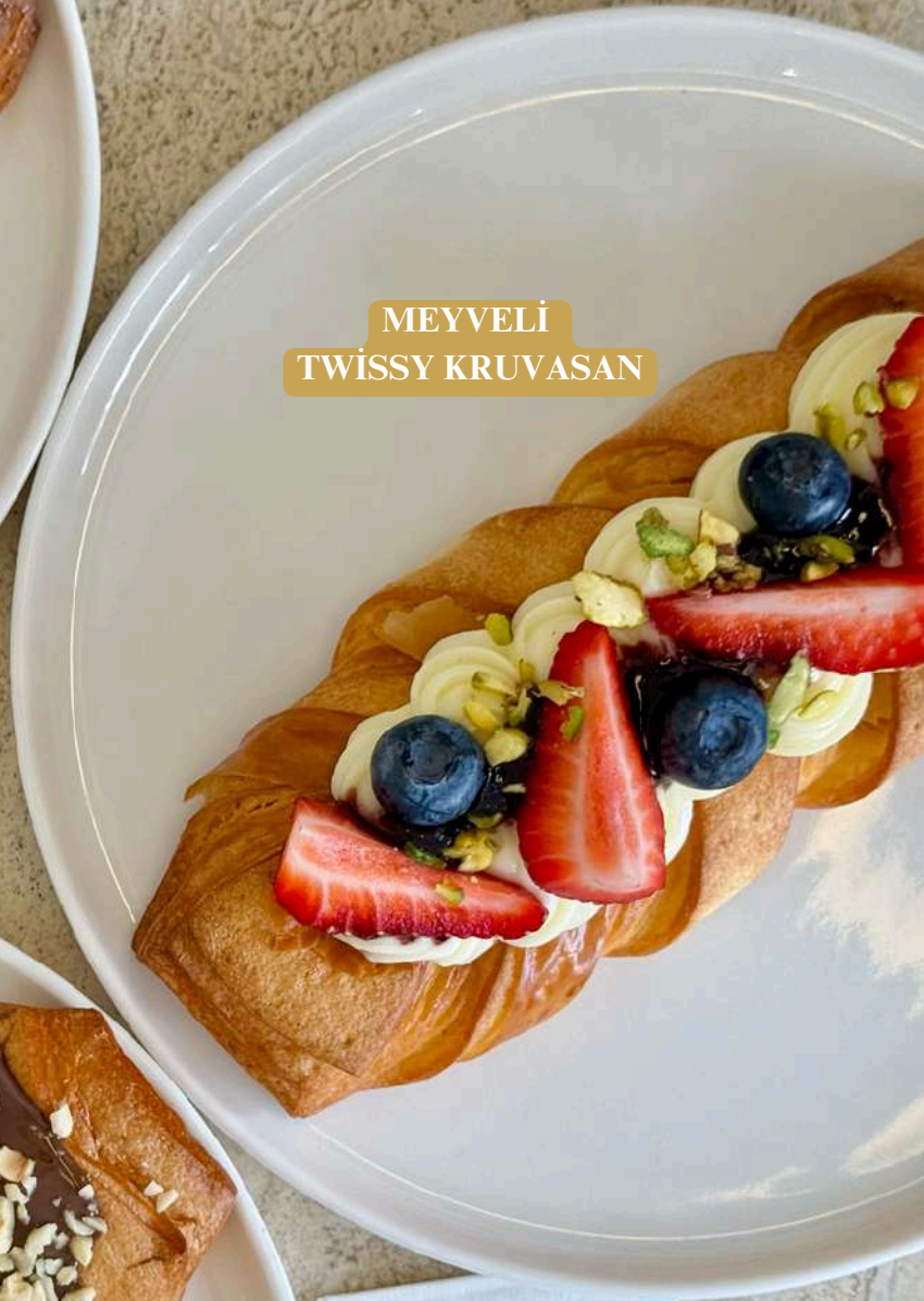
MEYVELİ TWISSY KRUVASAN