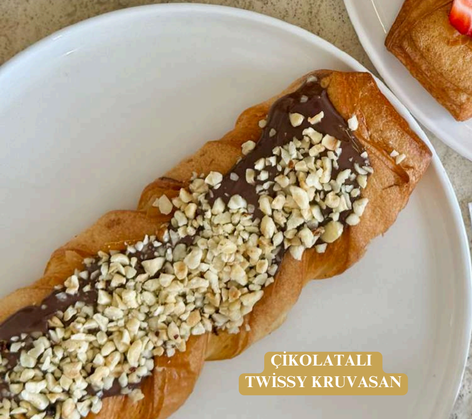
ÇİKOLATALI TWISSY KRUVASAN